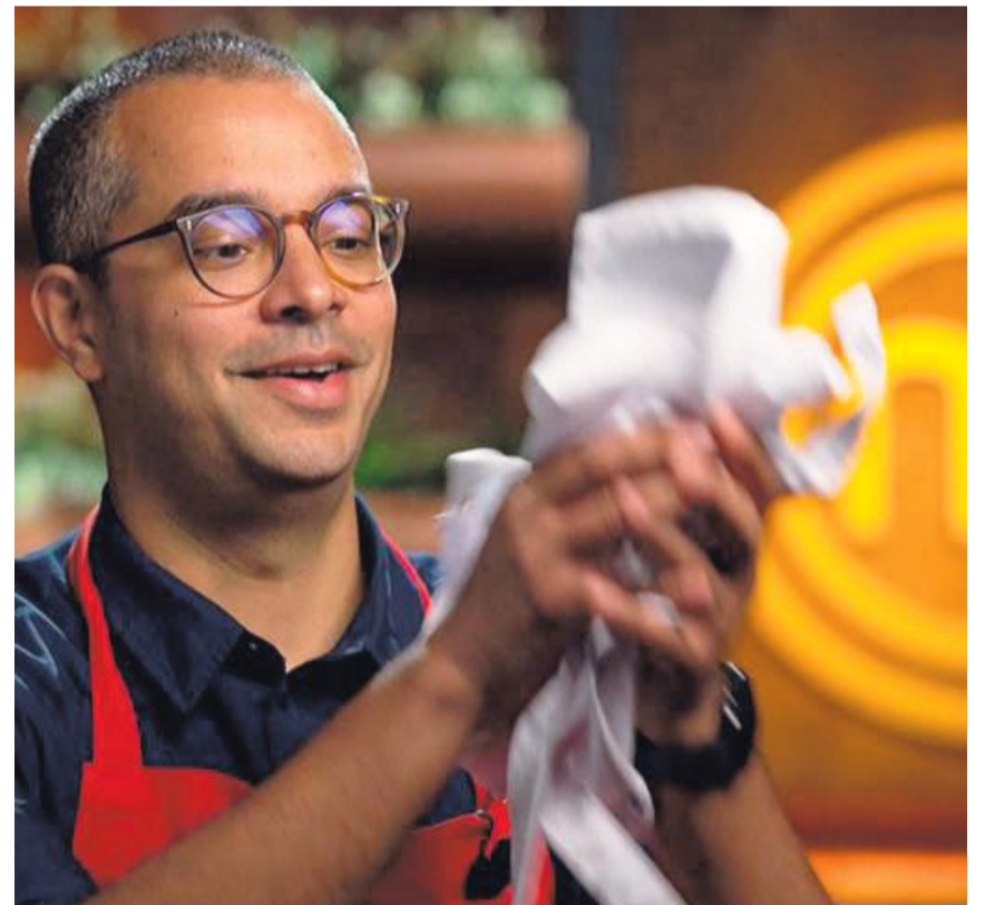
Der Hobbykoch freut sich, nach der Hoffnungsrunde die rote gegen die weisse Schürze austauschen zu können.